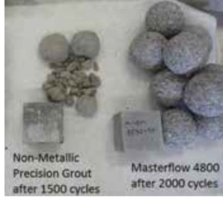
Şekil 3. 1500 ve 2000 çevrim sonrasında grout numuneleri.