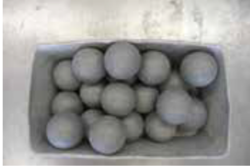
Şekil 2. Darbe için kullanılan çelik toplar