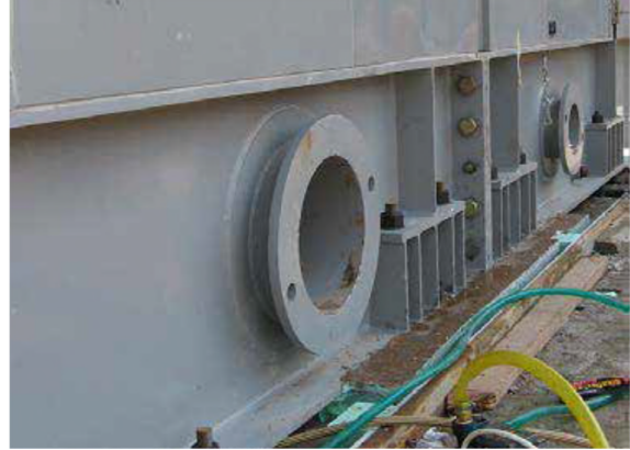
Şekil 1. Grout dökümünden önce türbin temelinin ankraj deliklerinde suya doyurma ve fazla suyu tahliye etme işlemleri

Beton yüzeyde donmuş kısımlar, kütleme amaçlı kullanılan membranlar, su yalıtımı uygulamaları, yağ lekeleri, kaymak tabakası ve toz iyice temizlenmelidir. Beton yüzeyler pürüzlendirilerek hazırlanmalı ve eğer su sızıntısı varsa tahliye edilmeli veya uygun bir şekilde tıkanmalıdır. Grout dökümünden 24 saat önce döküm yapılacak alan suya doyurulmalıdır. Yüzeyler nemli olmalı fakat yüzeyde fazladan serbest su kalmamalıdır. Özellikle civata deliklerine dikkat edilmeli ve bu deliklerin su içermediğine emin olunmalıdır. Gerektiğinde deliklere ve boşluklara basınçlı hava uygulayınız. Taban plakaları, civatalar, vb. yağ, gres ve boya gibi maddelerden arındırılmalı ve temiz olmalıdır. Ekipman yerleştirilmesi ve konumu ayarlanmalıdır. Ayar takozları (şimler) grout priz aldıktan sonra çıkartılacak ise, groutun yapışmaması için hafifçe yağlanmalıdır.